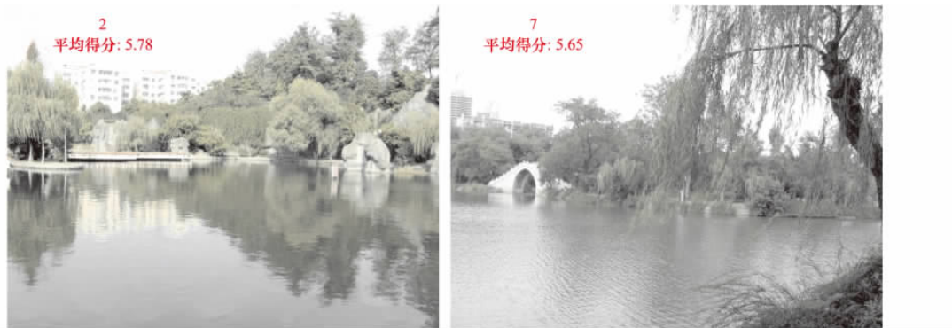
图 2 得分较高的两张照片