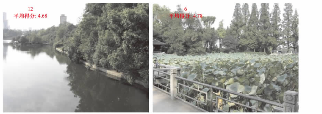
图 3 得分较低的两张照片