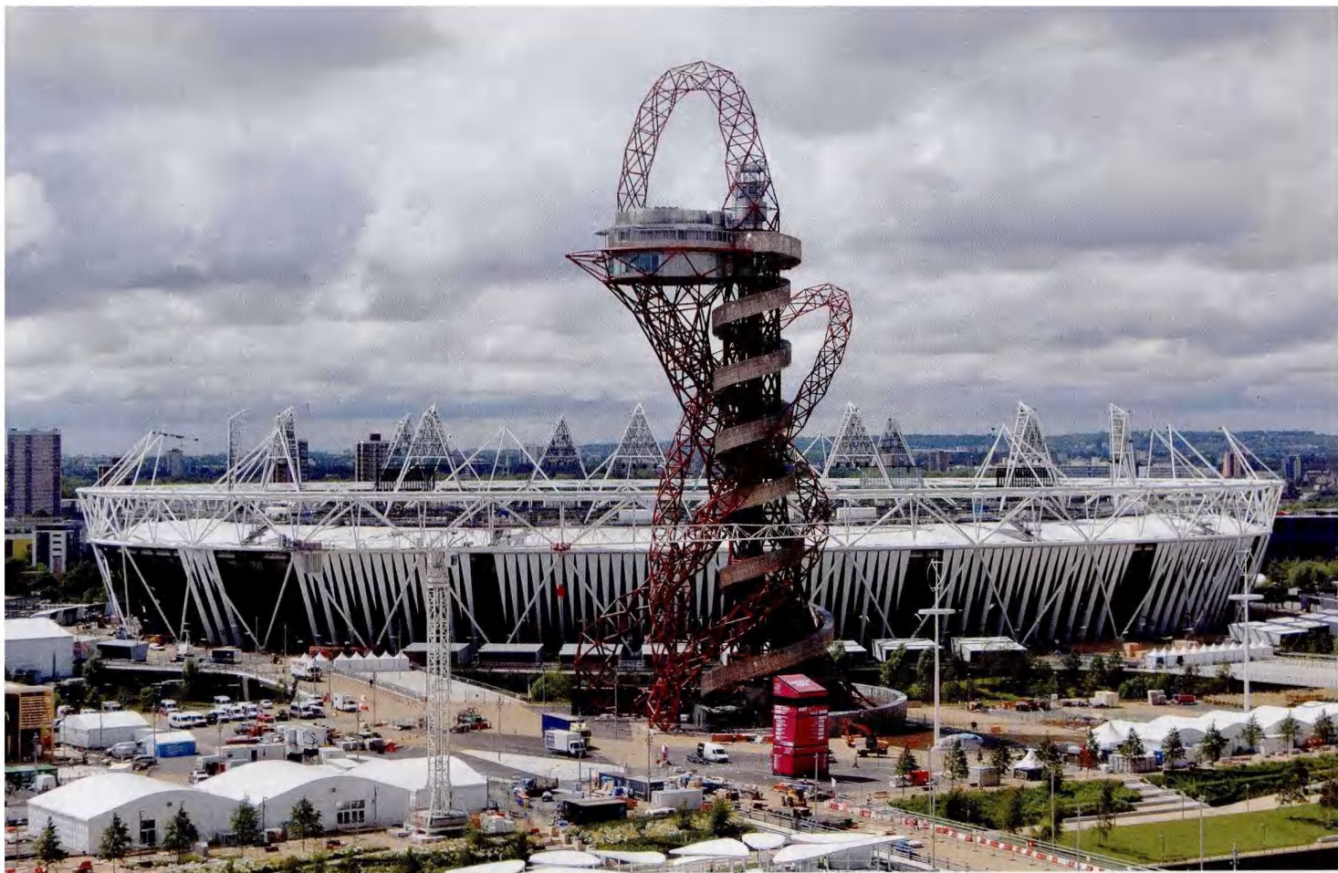
伦敦奥运会的标志性建筑伦敦碗（伦敦奥林匹克体育场）与安赛乐米塔尔轨道塔。