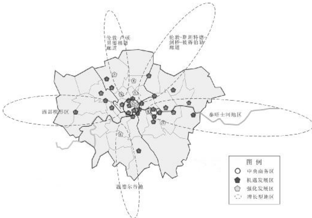
图 2 大伦敦地区的未来空间发展战略规划框架

《伦敦规划 2011》提出伦敦的经济发展目标主要是实现国内经济与人口的增长,满足国内发展需求。通过向各种产业提供适应其发展的产业环境来促进伦敦多样化经济的发展,增强国际竞争力,使其经济成果惠及整个大伦敦地区。然而,在新的环境形势下,如何应对气候变化威胁,是规划的核心内容,也是联结各方面政策的纽带。为此,市长编制了气候变化适应策略及减缓策略、能源策略,以及废物管理、空气质量、水和生物多样性保护等相应策略。结合环境保护策略,《伦敦规划》将经济发展规划、交通规划、气候变化规划等综合考虑,促进伦敦经济逐渐向低碳经济转型,通过高科技产业、绿色商业部门、可更新能源部门、循环经济、互联经济等新兴产业部门的发展,绿色城市的设计、公共交通系统的整合完善等,不断降低碳强度,提高资源利用率,适应并减缓城市气候变化。以建筑减排为例,它对居住性和非居住性建筑设定减排目标的三个阶段(2010-2013年,2013-2016年,2016-2031年),将阶段性减排任务量化,争取在 2031 年实现伦敦“零碳”排放。