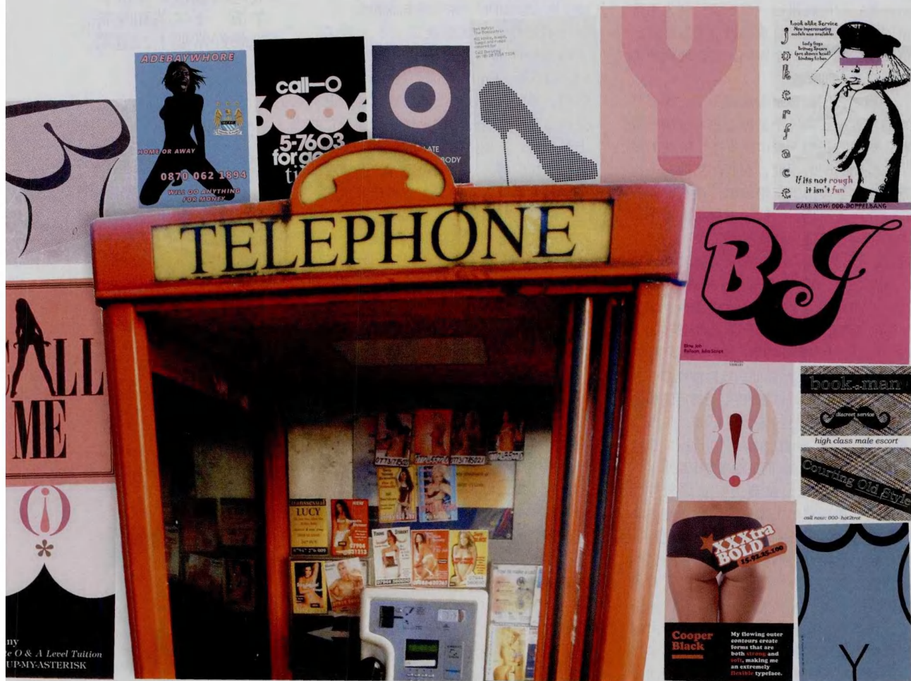
四周为《wall paper》杂志策划的Tart cards设计展中的部分作品 中间为Tart cards栖身之地——英国红色电话亭

有这样一个说法：称得上“当代艺术”的艺术已经不存在于传统意义的艺术品中，油画、雕塑无情地被挡在门外，而当年约翰·列侬和大野洋子演绎的《Bed - in For Peace（床上和平运动）》和翠西·艾敏的作品《床》似乎能解释这一定律。■