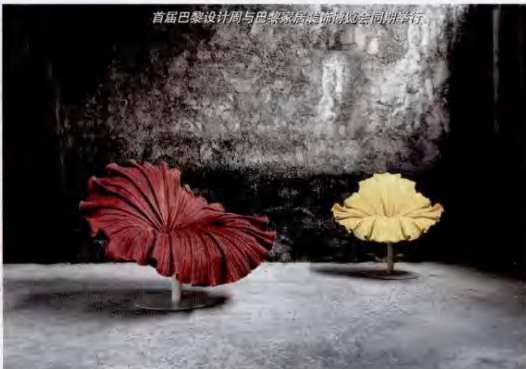
首届巴黎设计周与巴黎家居装饰博览会同期举行