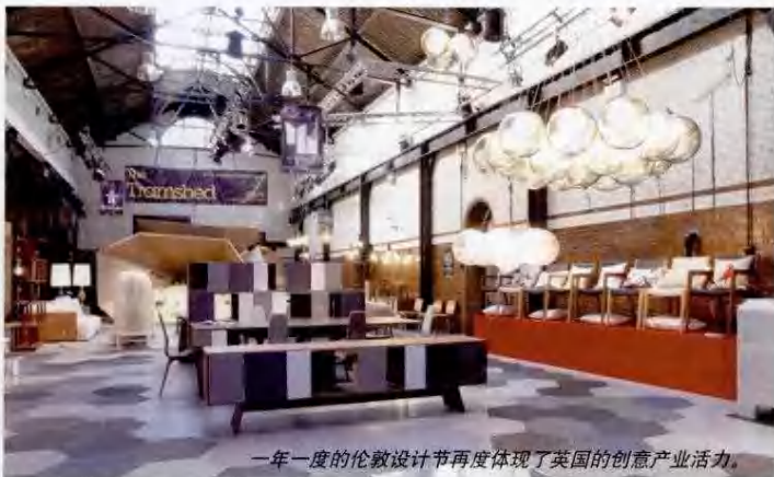
一年一度的伦敦设计节再度体现了英国的创意产业活力。