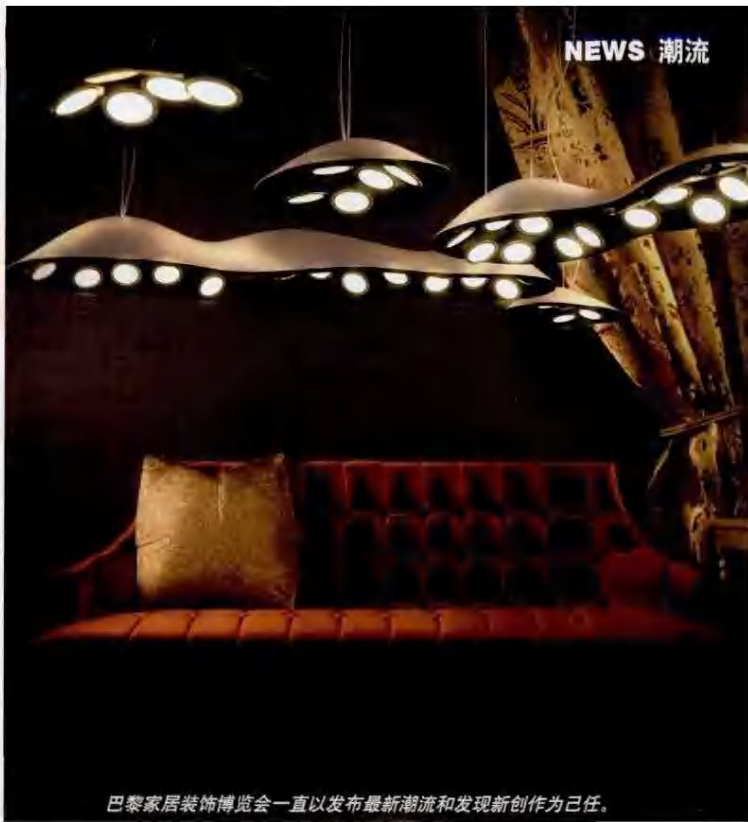
巴黎家居装饰博览会一直以发布最新潮流和发现新创作为己任。