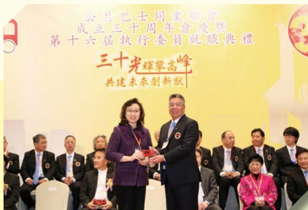
公共巴士同業聯會 秘書處

公共巴士同業聯會一直秉承為非專營巴士同業爭取良好營商環境的精神，就具爭議性的題目廣泛諮詢會員意見，再與有關政府部門或相關人士詳細商討，望能在互諒互讓的情況下，達成共識。本會十分歡迎各位非專營巴士營辦商加入我們這個大家庭，為業界共同拓展未來的路向。