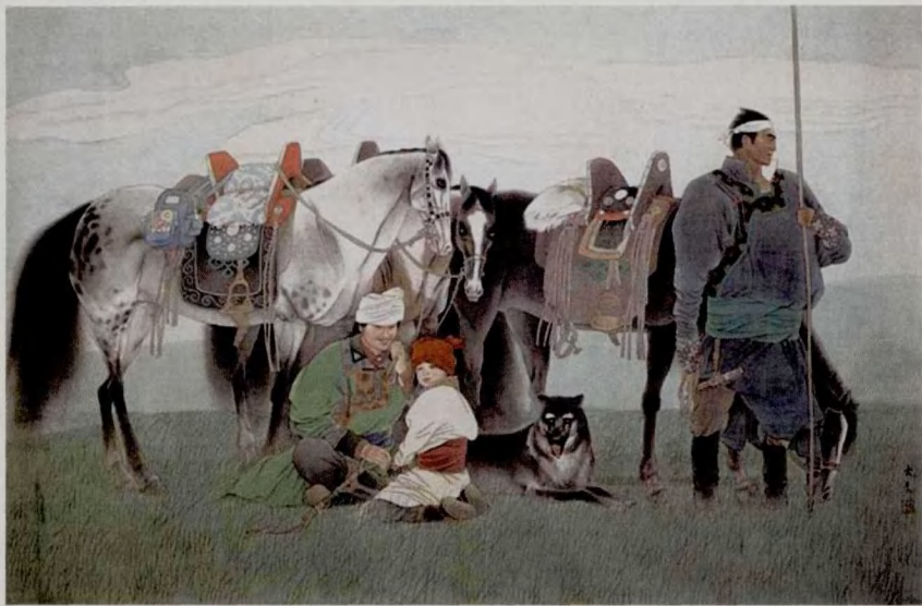
马背上的民族 刘大为

由巴黎中国文化中心、中国对外文化集团、大雄城(北京)文化传播有限公司主办的“东方之美”——刘大为绘画作品展不久前在巴黎中国文化中心开幕。