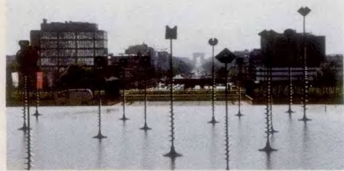
大拱门建在与凯旋门、香榭丽舍大道和协和广场的同一条中轴