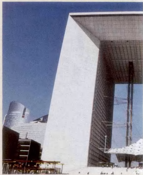
拉德芳斯区的市标建筑——大拱门