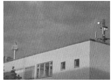
图 1 德国的基站

尽管只考察了这些城市的部分区域,但就目测观察基站个数这个角度而言,德国城市的移动基站密度很低,几个街区之内难觅到一个。而且在笔者步行或开车通过这些街区的随行考察中,信号功率也很低,这就基本排除了存在经过刻意伪装的基站的可能。德国的基站一般多建在公共建筑的房屋顶上,鲜见像中国城乡到处可见的基站铁塔。有一座基站建在大学的一幢三层办公楼的屋顶,天线离最近的教室大约 20 m。如图 1 所示。德国公众使用手机的频度也很低,无论是街道上,还是在酒吧、咖啡馆或大学校园里,很少见到公开场合打手机的现象,在德国的大学,印象中从未见过德