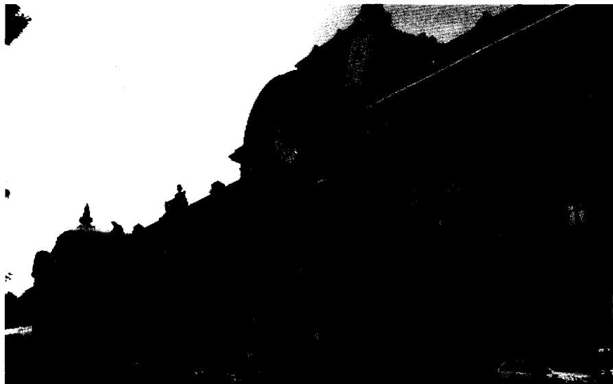
在加强对历史建筑保护的同时，巴黎也非常重视对资源的合理开发利用，实现了文化功能、经济功能和社会功能的协调

黎有众多的博物馆资源，这些博物馆大都是由历史建筑改造而成的，既有原来的皇宫等有文化价值的建筑物改造而成的，如凡尔赛宫、卢浮宫就是由皇宫改造成为博物馆的典型代表；也有的是一些随着城市的发展不再适合承载原有功能的工厂、火车站等建筑改造而成的，比如奥赛美术馆就是由原来的火车站，保留建筑外观风貌的基础上，对内部进行改造，成为仅次于卢浮宫和蓬皮杜国家文化艺术中心的法国第三大艺术美术馆。这些博物馆，不仅是展示皇宫文化等自身特色文化的重要载体，而且成为法国乃至欧洲文化艺术的集中展示地，比如卢浮宫博物院收藏了40万件文化艺术精品，既有法国的绘画和雕刻艺术，也有世界各国的艺术精品，从古埃及、希腊、罗马的艺术品，到中国等东方各国的艺术品。