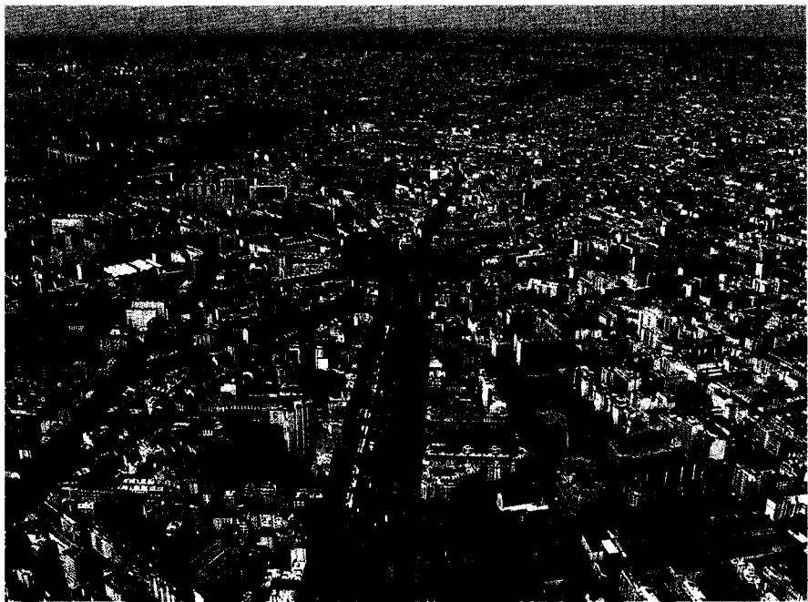
巴黎是全球文化艺术之都，也是世界上旧城风貌保护较好的城市

北京市“十二五”规划明确提出“要倍加重视文化的传承，加强历史文化遗产保护”。巴黎是全球文化艺术之都，也是世界上旧城风貌保护较好的城市，基本上保留并延续了19世纪中期的建筑风貌和街巷肌理，到处彰显着巴黎古城的人文魅力。考察巴黎的历史风貌保护和文化资源利用，其一些保护与发展的经验非常值得北京借鉴