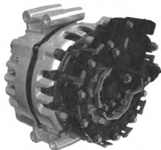
图2 12 V皮带式起发电一体机