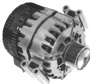
图3 48 V皮带式起发电一体机

图3所示的48 V起发电一体机是混合动力市场的高性价比解决方案。该系统采用“小配件赢得大市场”的策略，有效帮助车辆减少约10%的燃油消耗和二氧化碳排放。