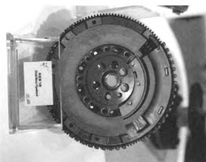
图1 双质量飞轮 术创新又向前迈进了一大步。

图1所示的双质量飞轮可以显著减少发动机的震动和噪声。紧随以高扭矩降低二氧化碳的排放需求，双质量飞轮可进一步缓解发动机震动，尤其在发动机低转速工况下。这一技术的推出意味着动力总成技