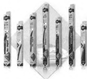
图5 SWF优视系列无骨雨刮 一按即可的接口设计，使雨刮安装更为便捷。

作为法雷奥优选系列的创新产品，图5所示的优选无骨雨刮曾荣获“2011年中国售后市场汽车零部件品牌产品最受欢迎奖”。该产品采用了TEC2配方，能有效提升雨刮的使用寿命；全新的3D气流控制技术，帮助刮片更好地贴合挡风玻璃，提升刮拭效果；一按即可的接口设计，使雨刮安装更为便捷。