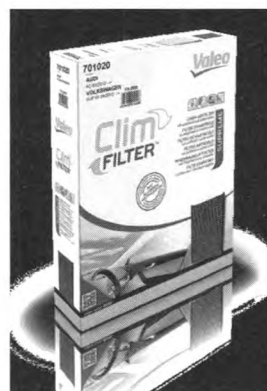
图6 多元酚高效空调滤清器

雾霾天驾驶一直是困扰车主的难题，图6所示的法雷奥多元酚空调滤清器不仅能有效抵抗PM2.5，还能消除92%的吸入性过敏源。作为欧洲第一款能消除过敏源的空调滤清器，该产品有效结合了活性炭和多元酚技术，为车主提供更为健康安全的驾驶环境。法雷奥多元酚空调滤清器在莫斯科国际汽车配件展上荣获了“年度创新技术大奖”。