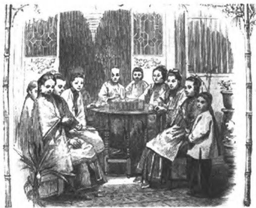
图2 中国的家庭生活之五

果;坐在右边的那位妇人正要去抽一口在小婢女手里拿着并刚刚用火点着的水烟筒。客人们一到马上就会上茶。过一会儿,女主人就会分糖果、添新茶” [1](P463) 。可以看出,女性客人进行日常拜访时,主人招待以喝茶吃糖果,尽自己的地主之谊。