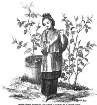
图6 中国采茶女——根据一位中国画家的作品绘制

概而言之,《伦敦新闻画报》出于满足英国社会了解新闻大事的需要,提供了丰富多彩的内容,其中涉及到了中国茶文化的多个方面,不仅