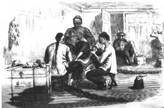
图1 中国香港人在吃饭

画报中多次涉及中国人的日常生活,展现了日常饮食、日常待客、游逛购物与饮茶的关联。根据画报文章,中国人的日常生活往往与饮茶有关。比如,画报中登载的1857年目睹在香港的普通劳动者吃饭场景,“中国人正在吃chow-chow,这是一种用筷子吃的食物。‘北京号’上有这样的乘客。他们的小烹调锅在右侧,茶具在左侧,香蕉挂在墙上,菠萝作为甜点。” [1](P380)