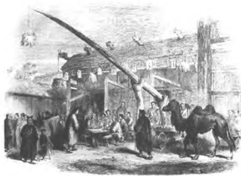
图4 北京的一座茶馆——根据本报特派画家的速写绘制

把喜爱的鸟带在身边。“有一个男人手里用木棍举着一只鸟,端坐在中间那个茶桌边。中国人更喜欢这样把鸟儿带在身边,而不喜欢拎着鸟笼。在鸟的翅膀下面拴着一根线,这样它虽然有活动的自由,却不能从主人身边逃走” [1](P476) ,市民在茶馆休闲娱乐的情景跃然纸上。