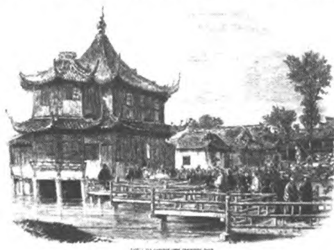
图5 上海城隍庙茶馆

至于上海的茶馆,画报中用图画展示了“城隍庙茶馆”的情形,还言明了“图画根据英国人桑德斯先生的照片所绘制,而这个茶馆最近为在上海的法国军队所占据,所以此时变身为军营了” [1](P513) 。画报中没有对其多加说明。画报中所谓“城隍庙茶馆”实为著名的“湖心亭茶楼”,本人在此略作介绍。茶馆最早出现于上海大概始于咸丰元年,湖心亭设为茶楼为清咸丰五年(1855)。湖心亭这一建筑为乾隆四十九年(1784)改建而成,此处原为鳧佚亭旧址,是著名的豫园胜景之一。设为茶楼时,最初名为“也是轩”,后更名“宛在轩”。整个建筑古色古香,颇具中国古典风格,是老上海的标志之一,可能正是