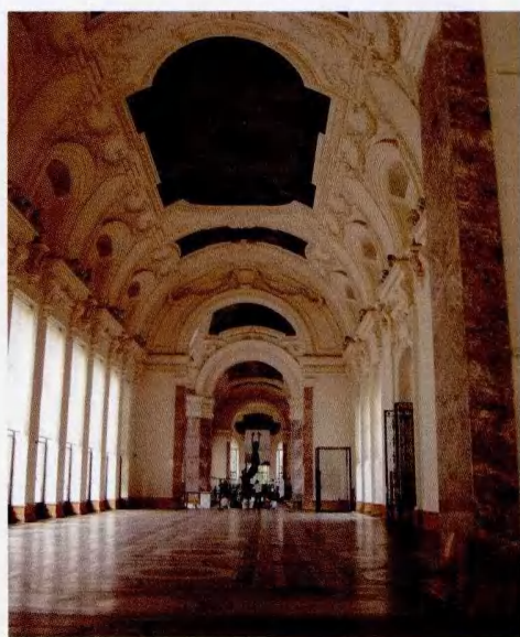
小皇宫博物馆悠长大厅