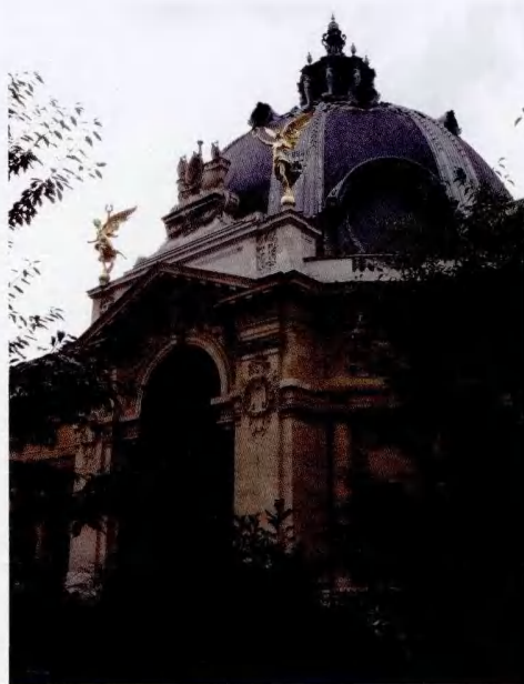
小皇宫博物馆雅致一角

和卢浮宫、凡尔赛宫相比，小皇宫博物馆显得秀丽精致、别具一格。博物馆管理方面介绍，巴黎政府从2000年开始，花费了大约5年时间对这栋100年前的建筑加以重新修缮，一方面尽最大可能保留它原有的历史面貌，一方面又尽最大努力使其与小皇宫博物馆的功能定位相适应。在浏览大厅陈列的艺术品间隙，时时看见三三两两的游客闲坐在内部小花园的四周，恬淡悠然地享受洋溢着博物馆艺术气息的生活。忽然就联想起那句印第安古谚：连赶三天路后，要停一停脚，让灵魂得以安歇。面对越来越纷杂繁复的社会，