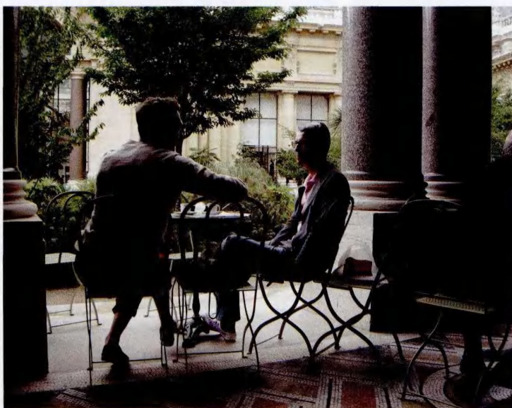
小皇宫博物馆悠闲游客

小皇宫博物馆诠释出：历史与现实、文化与自然、物质与非物质、可移动与不可移动等不同时代、形态和形式的遗产在博物馆受到保护进而传播成为可能——这就是博物馆不断更新、日益强大的社会职责。