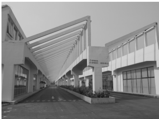
图 2 改造后的京棉二厂厂房(局部)