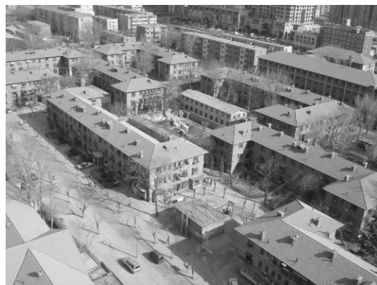
图 3 京棉二厂居住区 1950 年代住房

此外,京棉二厂的居住区与生产区之间仅一路之隔。居住区的规划设计是在苏联专家的指导下完成的,整个住宅区采用“周边式”、“双周边式”的街坊形式,每个街坊占地约 1~2hm 2 ,住宅沿四周道路边线布置,呈“T”形或“L”形分布。住宅全部被设计成三层楼房,楼层间距较大,外墙以红砖砌筑,屋顶形式以两坡或四坡为主,铺设灰色波形屋面瓦(图 3)。居住区在建成之初,内部设计布局非常先进,客厅、厨卫一应俱全,然而后期管理过程中,由于单位住房紧缺,原先设计 1 户居住的四居室,被强行安排住进了 4 户,从而导致住房拥挤、房屋及设施老化加剧等问题。总体上,笔者认为在快速城市化城市文化缺失、城市设计与建筑风貌千城一面的现实背景下,体现了典型时代特色的京棉二厂居住区也同样需要保护,并在保护的基础上进行改造。实际上,目前面临的居住问题主要存在于住房分配和管理不当方面,而住房本身的结构、质量以及建筑外观仍然具有保留和再利用的价值。