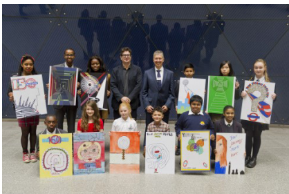
7. “迷宫”系列活动之海报绘画比

路 ③ 的优化改造项目中,计划组就将邀请对象锁定著名的法国艺术家 Daniel Buren ④ 。作为他在英国的处女作, Buren 以“形状、颜色和他标志性的条纹”为概念出发,为该站量身打造全新的站内空间,不仅延续了他个人的艺术实践,也使这样的国际级艺术作品走进地铁乘客的日常生活。