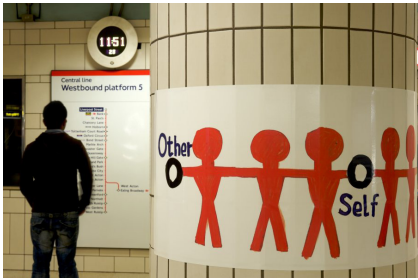
4. 伦敦地铁公共艺术项目“善举行动”