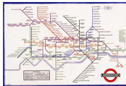
2. 伦敦地铁地图