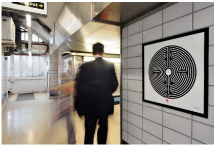
6. 伦敦地铁 150 周年艺术项目“迷宫”