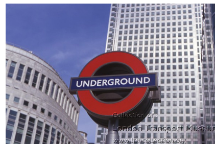
1. 伦敦地铁圆形图标