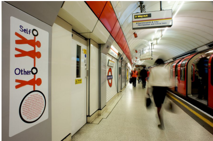
5. 伦敦地铁公共艺术项目“善举行动”