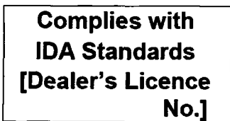
图2 IDA符合性标签 能源效率准入

除了安全方面的要求，新加坡根据电信法（Cap.323）对于电信设备供应商提出了设备注册计划，其监管机构为新加坡资讯通信发展管理局（IDA）。电信设备供应商必须在IDA认可的实验室进行测试并出具测试报告，然后由电信设备供应商出具供应商符合性声明（SDOC）并通过IDA注册，再将IDA符合性标签（见图2）打在产品、说明书或包装上方允许在市场销售。相比中国对于无线电产品的SRRC强制认证和入网产品的NAL强制认证均需要本地测试，IDA认证的流程就简化很多。如果企业已经有欧洲的CE RED或北美的FCC测试报告可以直接申请IDA注册，这样可以大大节约测试的周期和费用，只需承担相应的认证费用。