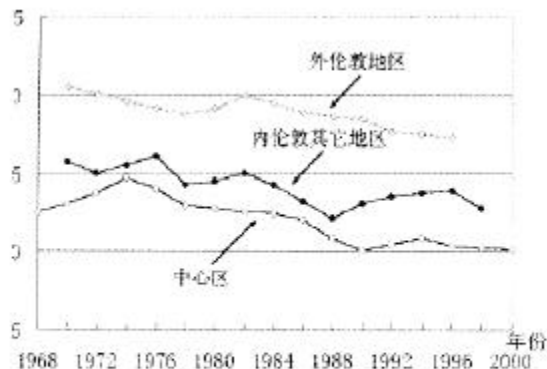
图2 伦敦交通高峰时间机动车通行速度(英里/小时)

由上述分析可以看出,中心区的交通拥挤问题已经严重影响到伦敦城市运行的效率和城市竞争力的提高。可以说,实行交通拥挤收费制度正是在上述背景下的产物。