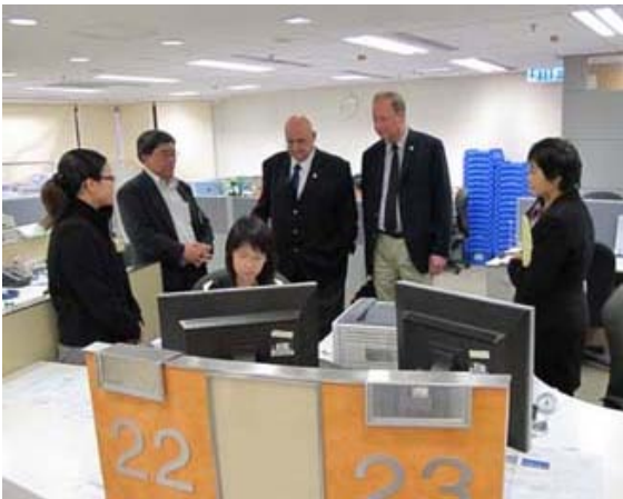
比利时土地注册处代表参观客户服务中心

此外，我们分别在2011年3月10日及5月17日接待了比利时土地注册处及韩国领事馆的两个代表团。是次代表团到访为我们提供了宝贵的学习及与同业分享土地注册制度最佳做法的机会。