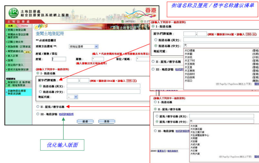
图1 – 按地址查阅土地登记册的新功能

此外，我们亦提升了登记用户的查询功能，让客户可以根据指定的查询日期翻查交易状况。更多资料例如订购土地登记册的付款交易编号及物业参考编号/地址/地段等，亦会显示于登记用户的结算单上(见图2)。这些服务提升项目均深受客户欢迎。