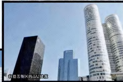
拉德芳斯区的高层建筑