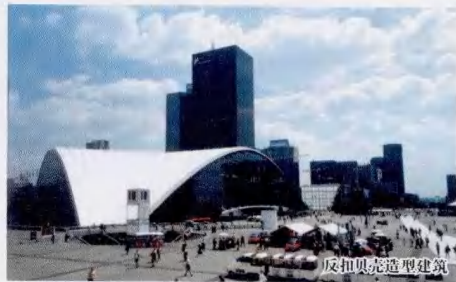
反扣贝壳造型建筑