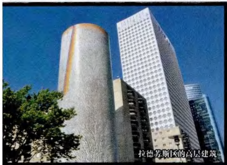
拉德芳斯区的高层建筑