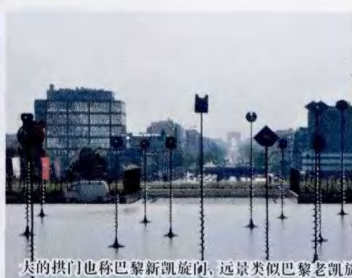
美的拱门也称巴黎新凯旋门，远景类似巴黎老凯旋门

建筑错落有致，精致多样，令人深感法国人不计经济成本的建筑架势和建筑魄力。很多奇形怪状的现代化雕塑和造型艺术矗立广场之上，令游客驻足，比如世界上最早出现的音乐喷泉、12米高的大拇指黄铜雕塑等。