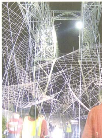
1-6. 沙龙 (Chalon) 北部口岸空间造型艺术试验