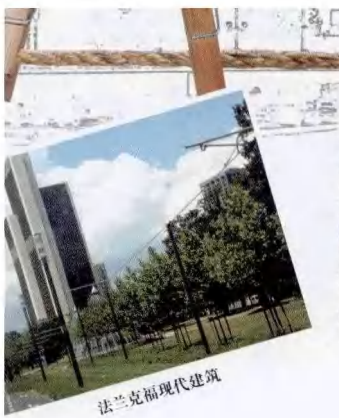
法兰克福现代建筑