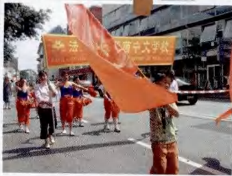
多元文化节游行队伍中的华裔女子学校队伍