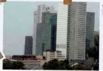
法兰克福现代建筑

万观光客涌入此地参加各种高层活动，这里是欧洲大陆最繁忙的会议场所。法兰克福拥有“德国国家最大的书柜”——德意志图书馆，德国法令规定1945年以后出版的德语印刷物都有义务提交它保存。大约500个出版公司集中此地，其中包括德国最大的出版公司，所以法兰克福称得上是世界图书业的中心。每年世界最大、最有名的书展在法兰克福举行，吸引了大约800多参展商以及25万参观者。