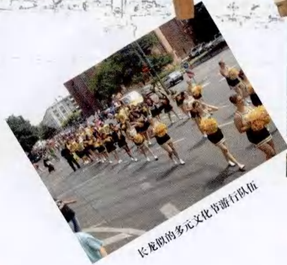
长龙似的多元文化节游行队伍