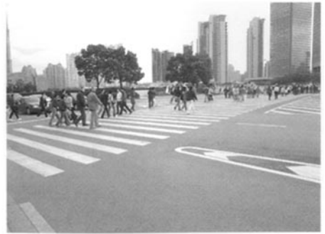
图3 世纪大道距离过长的过街人行道