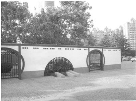
图4 世纪大道过于封闭的园林景观