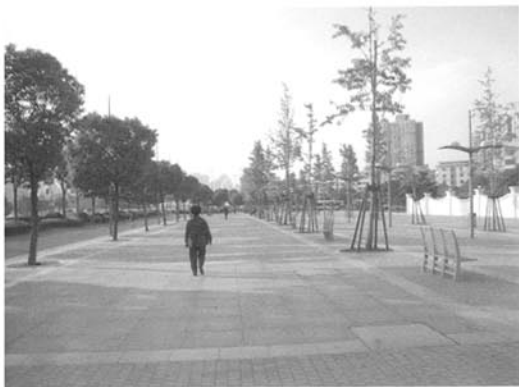
图5 世纪大道过于空旷的步行道