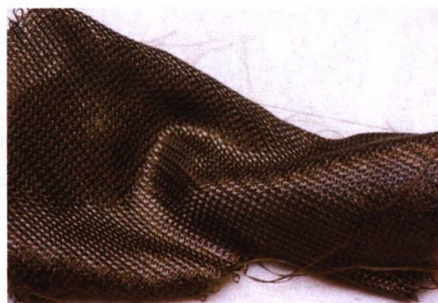
品锐至尚巴黎展以纺织材料拓展对世界的认知。