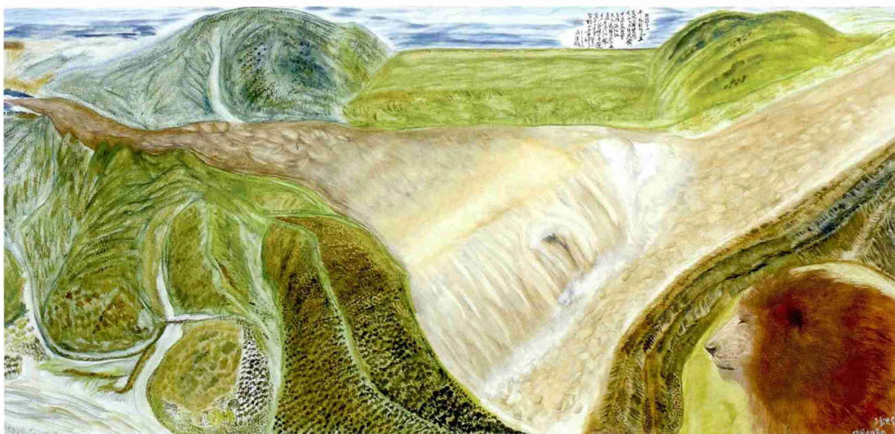
高山雄狮,尺寸200X320,年代2009

为学者型艺术家以其深邃广博的思想与独树一帜的艺术语言,才堪匹配世界艺术大师的桂冠。为此,联合国艺术家协会 Angela Dong先生对刘浩锋的艺术展览与活动进行了全程拍摄记录。