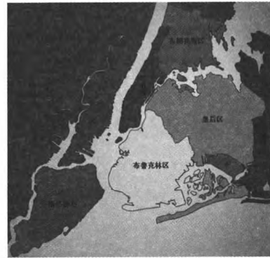
图2 纽约市行政区划图

纽约市已经连续四年制订了城市温室气体清单,是当前温室气体清单编制较为全面、系统的城