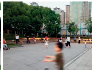
图5 小型餐饮(来源:自摄) 图6 活动广场(来源:自摄)