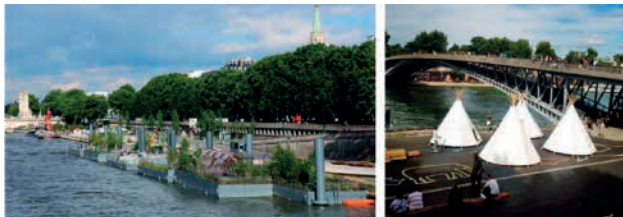
图 11 可拆除的活动设施

情况时,所有的设施可在二十四小时内全部拆除。同时,保留原有道路通行,做到对于城市交通产生最小影响的基础上建构完整独特的慢行空间体系(如图11)。