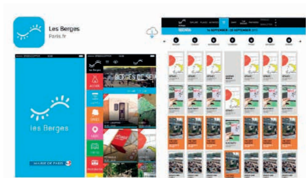
图7 官方网站和手机应用

2008年提出了“大巴黎计划”,而巴黎市也于2014年提出了一项名为“巴黎创新计划”的项目,开始针对城市的局部区域,以城市开放的公共空间、废弃空间等作为城市改造的切入点进行城市更新,致力于将巴黎建设成为城市更新的典范。塞纳河畔作为巴黎的滨水公共空间、市民交流娱乐的重要场