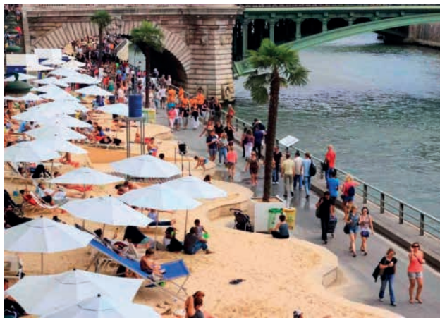
图10 滨水步行空间、沙滩