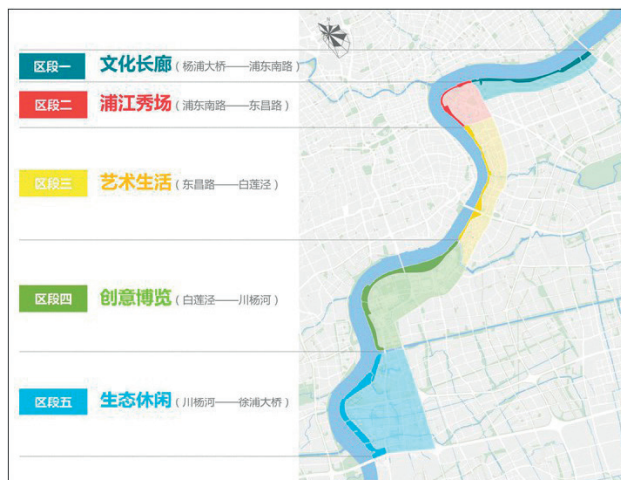
图4 黄浦江沿岸主题分段图