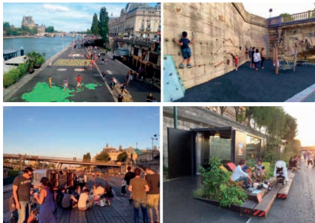
图9 儿童游乐场等户外活动空间。

在更新中两个城市都将“人”作为主体，重点考虑“人”的使用需求；将城市文化的继承和发扬作为更新过程中的重点，充分发挥独特的城市地域文化元素在公共空间中的重要作用；活化利用场地既有资源，引入各类艺术文化元素激发空间活力；凭借对城市公共空间的更新为城市全域旅游空间域的拓展打开了新世界的大门。因落地实施后产生不可逆的后果，河道左岸的公共空间更新采用了弹性的设计手法，赋予了城市更多的实验机会。设置了漂浮花园、集装箱、帐篷等可拆卸、可移动的、非永久的主要活动设施。保证在特殊