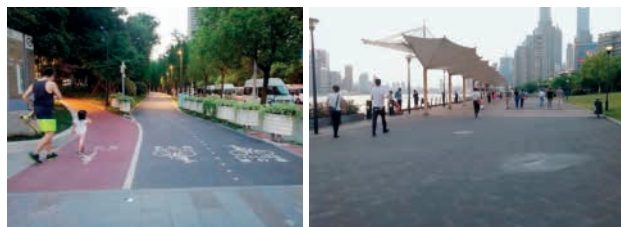
图2 慢行步道(来源:自摄) 图3 亲水活动广场(来源:自摄)