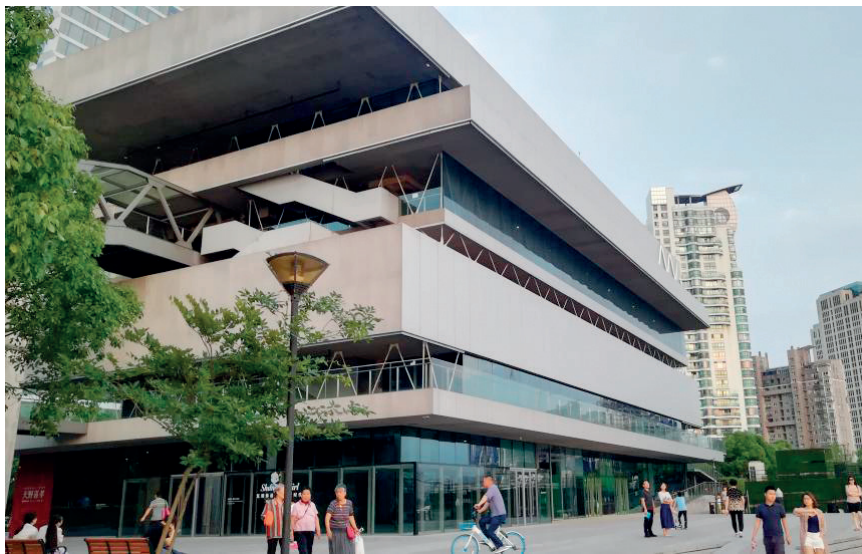
图1 艺仓美术馆

上海作为我国发展速度快、水平高的现代化大都市，其便捷化的交通、完善的基础设施以及极具现代化的城市风貌吸引着国内外游客的到来。作为上海市的地标河流和重要水道，黄浦江沿岸的滨水空间是上海极具自然水景和岸线资源的城市公共空间，随着时代的变迁，黄浦江的滨江岸线从早期的生产沿线逐渐转变为了如今的城市生活岸线。在市民生活、城市生态系统、