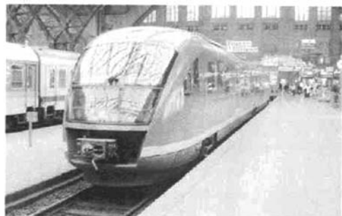
图6 人口密集区的市域线