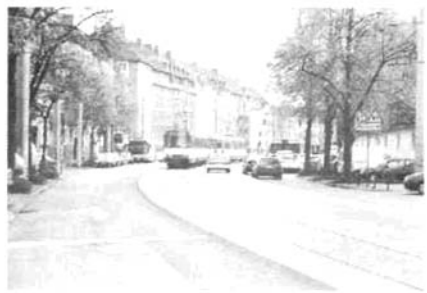
图14 轻轨轨道埋于混合交通道路上

7) 轻轨可采用完全专用道(包括地面、高架和隧道线路),或道路区的“独立轨道”(见图12);或将轨道埋于混合交通道路上,如图14所示,轻轨线路比街区路面略高(5 cm),采用特别颜色标注,发生交通事故时,轻轨线路也可用作道路交通。