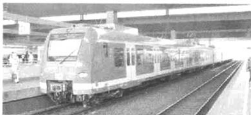
图5 最高时速为 140 km/h 的市域线

在柏林、法兰克福、汉堡、慕尼黑以及斯图加特,市域线系统已经发展成为对角交叉或切向连接的网络。在市区范围内,市域线系统与地铁功能重叠,共同提供城区交通服务。德国的市域线实例见图 5、6。