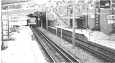
图10 站台沿纵向分成高区和低区

术支持。例如,仅轻轨网络采用高站台而有轨电车系统仍采用街道路面作为候车平台。若轻轨列车采用可折叠台阶,乘客就可从低平台甚至是街道路面直接上下车;另一种正在使用的解决方法就是,把现有混合运输所用站台沿纵向分成高低区(见图10)。