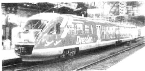
图 1 德国德累斯顿的 Desiro 列车

由于历史发展的原因,区域线系统采用两类列车:①重型列车,用于长途运输;②新发展的更加经济的轻型列车,如 Desiro 和 Talent 列车(见图 1、图 2)。发展轻型列车的目标在于,生产出成本远低于传统柴油电动车组,且寿命成本与性能相当的公共汽车接近。