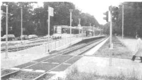
图12 杜塞尔多夫轻轨地面线车站高站台

2) 街区其他地表车站(经常和地表有轨电车共用),由于某些原因不能采用高站台而采用了特别搭