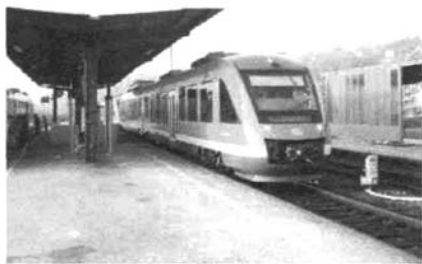
图4 Lint 列车(2005年)