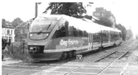
图 2 德国的 Talent 列车

出修改,即:旨在提供高耐压缓冲器和耐冲击前部结构。这种修改不仅针对区域轨道交通,也针对市域轨道交通以及地铁和轻轨。传统的过时的安全理念正被主动应对型安全措施所取代,且新型安全措施不降低整体安全级别。以下新概念代表了此方面的当前技术发展水平: