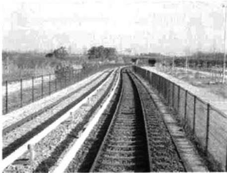
图7 慕尼黑到 Garching 的地铁线采用第三轨供电

由于第三轨供电具有相对简易且高电流的特点,因此第三轨供电(见图7)为德国多数地铁系统所采用,但有些地铁系统也采用接触网。