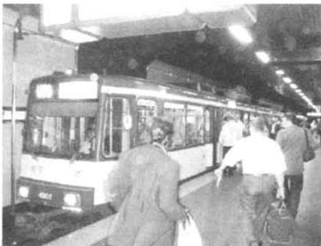
图11 轻轨车站 900 mm 高站台

1) 地下车站站台高度约为 900 mm(见图11),某些地面线车站也采用高站台(见图12)。