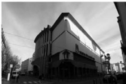
法兰克福现代艺术博物馆 MMK 图1

法兰克福现代艺术博物馆 MMK (Museum für Moderne Kunst) 位于德国法兰克福市中心大教堂的北部，是由一块三角形的地块而建起，形似“一块三角形的蛋糕”，设计师汉斯·霍莱因 (Hans