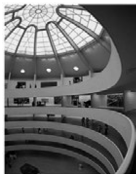
MMK (Museum für Moderne Kunst) 的中央大厅 图3

现代艺术博物馆 MMK (Museum für Moderne Kunst) 在结构上主要通过三个方面来实现的：一是功能上的变化。通过对空间的功能定位来做结构上的变化，当然我们这提到的功能并不是传统意义上所诠释的功能主义；设计师汉斯·霍莱因 (Hans Hollein) 可以算得上是一个功能主义者，但是却又在功能的本质上进行了扩展，因为他本人一直反对传统意义的功能主义。传统的功能主义完全不会考虑到建筑的非量化因素，如气氛、舒适度等。二是通过空间的层次来实现其节奏的起伏。如果说，听一曲没有节奏、没有高潮和尾音的歌是乏味的，那么建筑也是如此；MMK (Museum für Moderne Kunst) 之所以传达着让人意犹未尽、感叹的留恋，正是因为它的不断新奇的空间变化和丰富的空间层次感；特别是法兰克福现代艺术博物馆 MMK (Museum für Moderne Kunst) 的中央大厅 (如图3) 更是将空间的层次感展现得淋漓尽致。三是通过意境来创造艺术空间中的“一步一景”，这也是我们中国所讲究的和看重的一点。不管你从哪里去欣赏，都能让你体会到“一步一景”，它所传达给人的不仅是高品位的思想，也是 MMK (Museum für Moderne Kunst) 的艺术理念；这就验证了现代室内设计装修风格的一大特点“简约而不简单”。