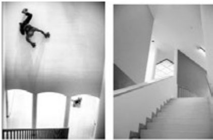
MMK (Museum für Moderne Kunst) 丰富而又含蓄的墙面色彩 图4

音响等综合元素传达出其室内的特征。法兰克福现代艺术博物馆 MMK (Museum für Moderne Kunst) 没有采用华丽的石材、鲜亮的色彩、丰富的材料去凸显它的与众不同。而是采用了朴素的颜色处理外墙,遵循了空间秩序关系空间秩序上采用了简单的色块处理,不仅保留了建筑空间的个性,尊重、照顾了传统建筑的艺术特点,同时又深刻展现了现代建筑室内空间的实用特点和艺术品味,而且更是起到了锦上添花的作用,把法兰克福现代艺术博物馆 MMK (Museum für Moderne Kunst) 所体现的优美、含蓄、朴素、亲切都一一都呈现出来,且熔载出了自己独具特色的室内设计风格。