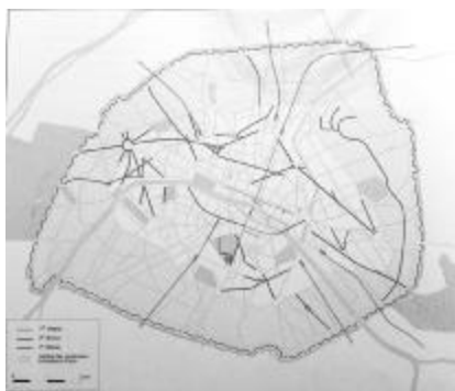
图1 法兰西第二帝国时期奥斯曼实施的三个道路网络阶段示意图

在法兰西第二帝国拿破仑三世强力支持下,奥斯曼男爵在19世纪50~60年代花费了近20年的时间进行巴黎城市大改造。奥斯曼改造巴黎的过程中,将市区内60%的建筑拆毁重建或改建,许多中世纪名胜古迹在他一声令下灰飞烟灭,这件事也令他为后世所诟病。今天,人们只能从美术馆悬挂的早期绘画作品中,去寻找巴黎往昔中世纪的风采。在这场改造中,1/3的中世纪和文艺复兴建筑被毁,西岱岛首当其冲,奥斯曼几乎拆毁了所有的中世纪建筑,用以打通一条南北贯穿的大路,今天的游客应该庆幸还可以看到幸存下来的巴黎圣母院。