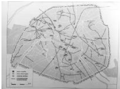
图5 法兰西第二帝国时期重要城市节点的公共广场重建

道路节点所在的城市广场,橘红色和粉红色区分了旧有和新建的广场,黄色点出重新调整的景观广场。城市公园计划将肖蒙山丘公园 (Parc des Buttes Chaumont), 蒙梭公园 (Parc Monceau)和 蒙苏黑公园 (Parc Montsouris)囊括其中。参考图6不同色块标示出奥斯曼改造前后的巴黎城市绿地分布图,西侧的布隆尼森林 (Bois de Boulogne)和东侧的文森森林 (Bois de Vincennes) 显而易见,是巴黎的两大绿肺。