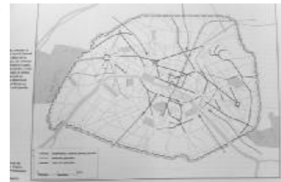
图4 法兰西第二帝国时代末,法兰西第三共和国初始时期的绿化道路