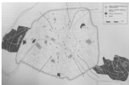
图6 巴黎城市公园和森林绿地 ■存在于奥斯曼改造前 ■奥斯曼时期改建 ■奥斯曼时期新建