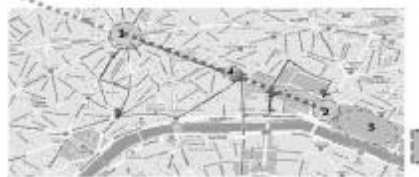
图3 巴黎历史轴线 1:星形广场-凯旋门 --- 香榭丽舍大街 4:香榭丽舍街心广场 2:协和广场 3:杜乐丽花园 卢浮宫 塞纳 La Seine