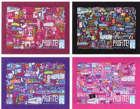
让人爱不释手的巴黎地铁车票

巴黎1900年开始使用地铁，至今已有近百年的历史。16条线路纵横交错，四通八达，可以将你送抵巴黎市区的任何一个角落。巴黎地铁分成两个系统：运行的范围在二环之内的叫作Metro，这个系统一共有14条线，即M1到M14；运行的范围超出二环的叫作RER，又称深层快线地铁，它将巴黎与周围的远郊连成一体，共有5条线，用字母表示，就是RER—A、B、C、D、E。