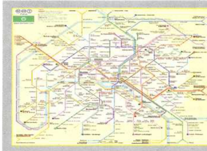
巴黎轨道交通线网图

如今，把地铁作为主要交通工具，是巴黎人的一种生活方式。巴黎人在谈到一个地理位置时，总是说：地铁某站。如果有个公司邀请客人去他们的办公室，或者邀请客人参加一个宴会，一般不安排汽车来迎接，只是告诉客人乘地铁怎么去，客人也决不会据此来判断对方的热情程度。■