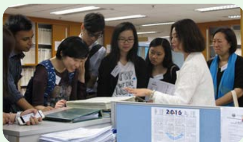
香港大学专业进修学院保良局何鸿燊 社区书院到访