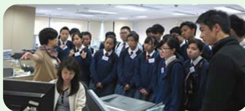
学生参观土地注册处客户服务中心