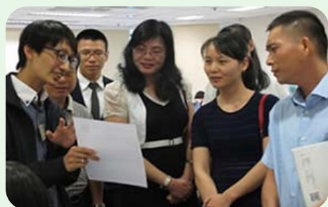
海南省地方税务局的代表团

我们与内地相关部门保持紧密联系。在2016年6月20日及7月7日，四川省国土资源厅及海南省地方税务局的代表团分别到访本处。该两次访问为我们提供了可贵机会，就内地和香港土地注册的最新发展交流意见。