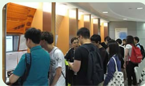
香港专业教育学院到访