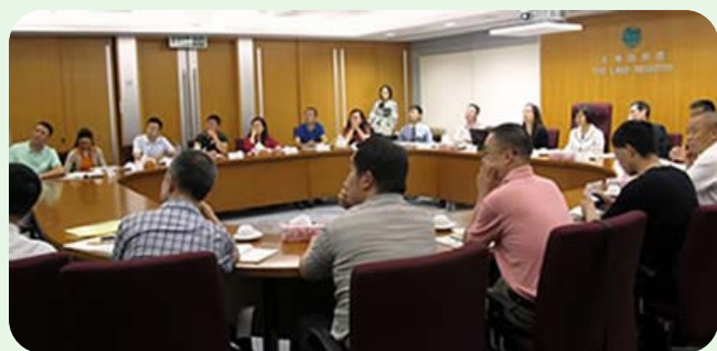
四川省国土资源厅的代表团