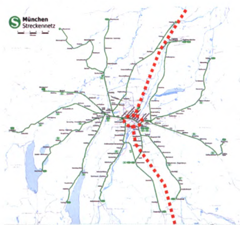
图 3 慕尼黑 S-Bahn 运行网络

由于郊区线路向城区汇集后均要通过市内通道,市郊列车开行也遵循这个规律,即各条线路的市郊列车交错顺序通过城区最为繁华的地段(椭圆内),之后再向郊区分叉,形成以中心通道对称的运行网络(红虚线两侧)。如图 3 为慕尼黑市郊列车运行网络,在城区通道上共有 7 条市郊线。