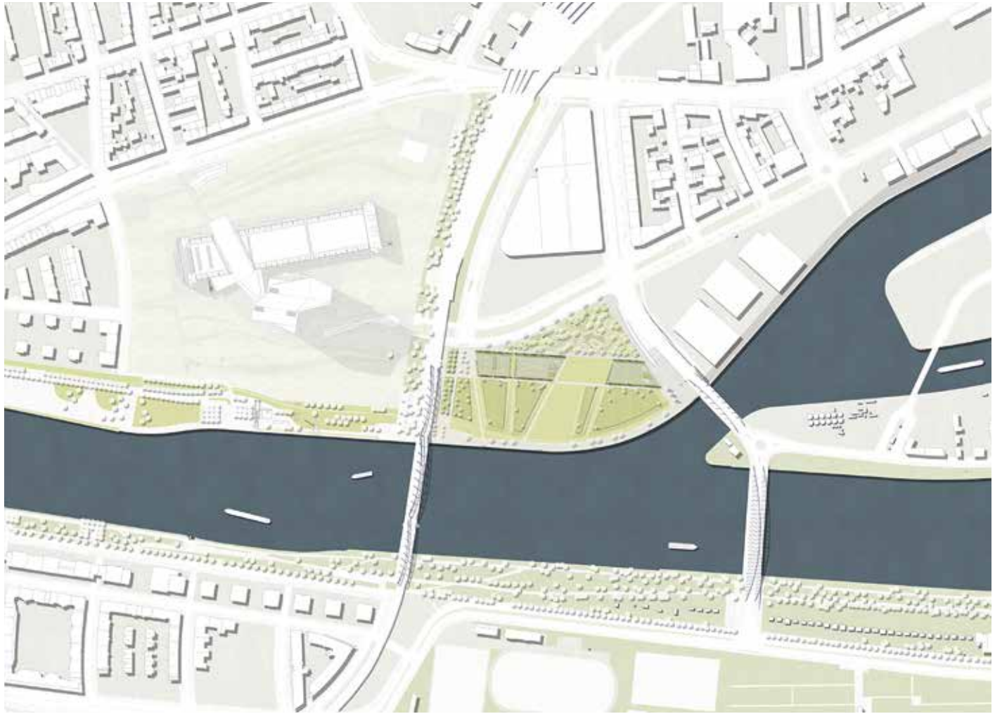
1 场地平面图 Site plan