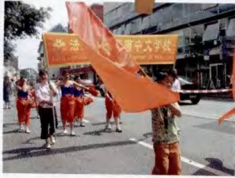
多元文化节游行队伍中的华裔女子学校队伍