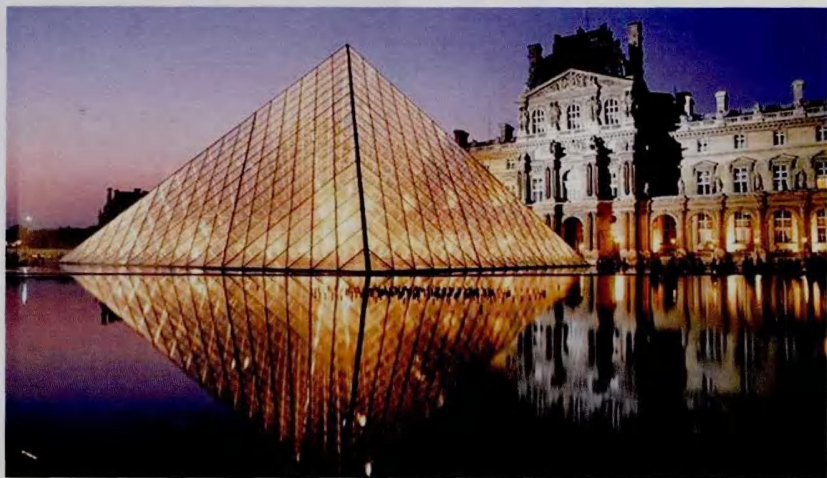
卢浮宫博物馆前的玻璃金字塔

这座大型玻璃金字塔高21米，塔身总重量为200吨，其中玻璃净重105吨。金字塔的南东北三面还有3