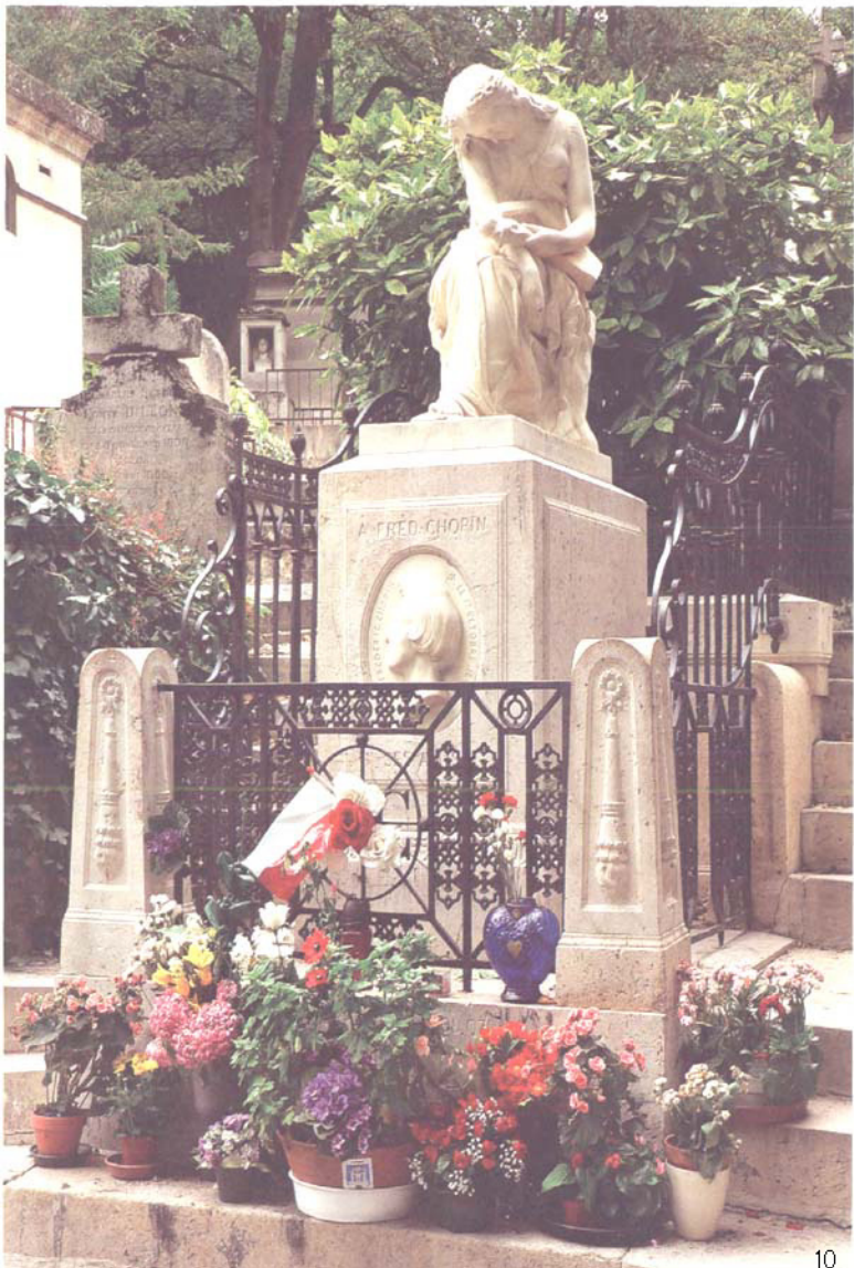
图6.7 墓园中各种风格的陵墓和雕塑