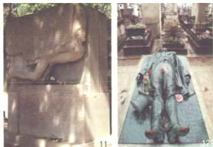
图11 王尔德墓 图12 努瓦尔墓 图13 巴黎公社社员墙 图14 死者纪念碑 图15 风景优美的拉雪兹神父墓园 图16 拉雪兹神父墓园中的纪念花园

手却被法庭宣判无罪。10多万愤怒的民众参加了他的葬礼并游行示威,间接导致了王室的覆灭。雕塑家达鲁(Aimé-Jules Dalou, 1838—1902)制作的青铜像记录下努瓦尔遇难的那一刻(图12)。