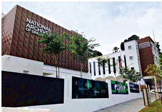
新加坡国家档案馆

新加坡口述历史中心隶属于新加坡国家档案馆,作为新加坡国家记忆的重要保存库,中心通过征集、访谈、建档、保管、研究、传播与推广,保存国家历史,传承民族文化。中心不断丰富和完善口述历史项目的规划,开展了新加坡先驱人物、多元种族社会、口述传统、表演艺术、医药服务、面临消失的行业、社区与公益服务、城市发展史、政治发展史、经济发展史、日据时期新加坡历史等主题的口述历史访谈项目。中心自成立以来,便非常重视访谈建档和资源