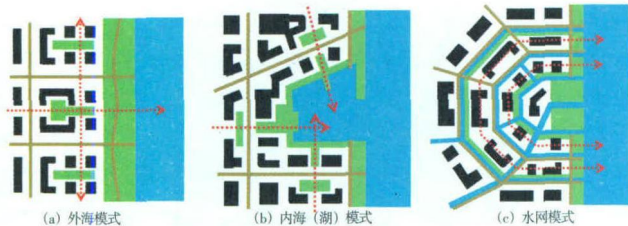
图3 滨海城市空间结构的3种模式