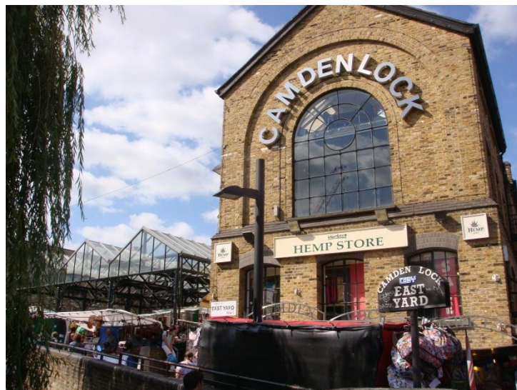
图 2 London Camden 市场

市场，以时尚为主题的 Camden Stables Market 市场，以及出名很早的 Camden Market 市场等。这个市场地区不仅有各色的特色市场，还有很多的餐厅、酒吧、剧院与影院等。在周末时候，所有的店面全部营业，满大街人山人海，将整个 Camden 镇都变成了娱乐的海洋。