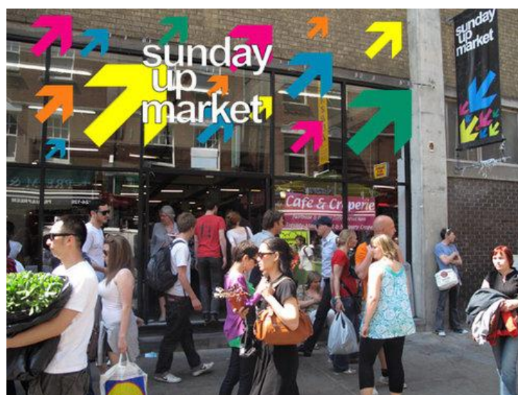
图 3 Sunday Market

适当提前开张、延时关闭各 1 小时。此外，伦敦还有一些专门的周日市场（Sunday Markets）（图 2），这类市场往往存在于一些大型市场中，有的具有专门的建筑空间，有的是露天形式的，多以专业市场形式为主。例如，位于伦敦东部著名的 Brick Lane 市场周边的 Sunday Up 市场就是一个只