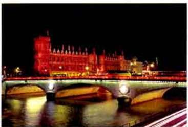
图3 巴黎市区塞纳河段上历史悠久的桥梁

看作政府提升塞纳河沿岸环境品质的施政意象得到较好落实的成功案例。此外,该协议将市区河段内所有桥梁的管理权划归巴黎市政府,在此之前,桥梁的维护一直由中央政府部门统一负责并管理,包括结构、防水、基础加固和桥身雕塑的修护等。作为精美的建筑作品,塞纳河上的多座桥梁被列入重点古迹保护名单(见图3)。