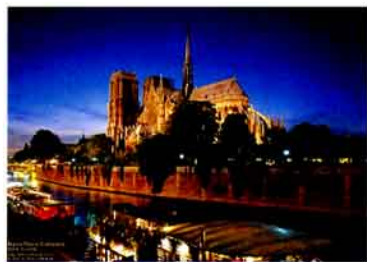
图7 在塞纳河上乘坐游船是游览巴黎的重要观光活动。