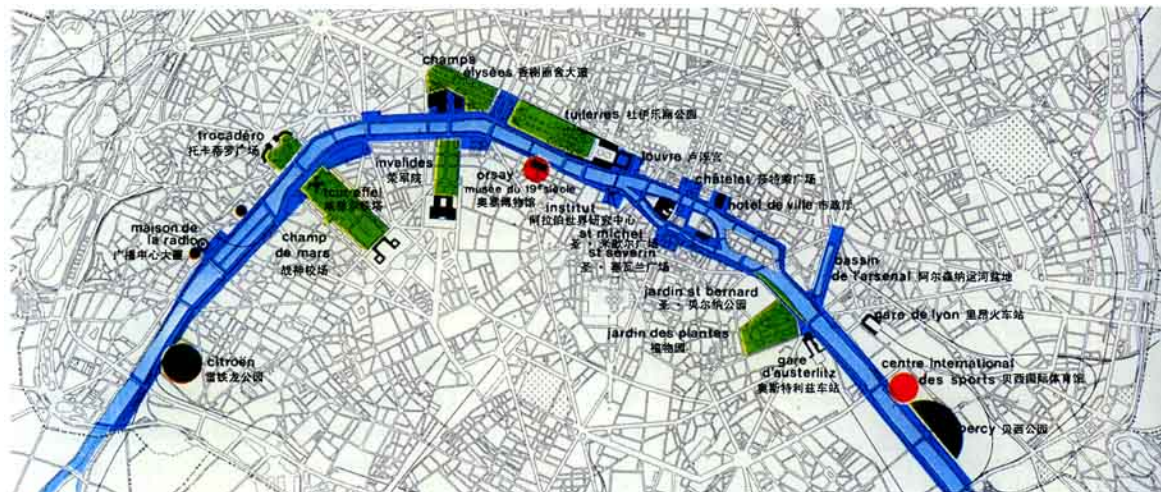
图4 两大公园之间的塞纳河段沿岸是巴黎重要的亲水公共空间

据此,巴黎政府进一步确立了“对塞纳河的保护与利用,始终以求避免古迹与现代生活脱节”的原则,政府鼓励群众利用塞纳河沿岸的城市开放空间组织文化和商业活动,动员市民参与研讨滨水空间的开发与利用计划,并将提高滨水空间的适用性作为核心工作目标。对于陆续实施的具体举措和整修工程,大塞纳河规划要求两岸的铺地、墙面、照明设计相互协调,并与其他街俱自然交融,努力把塞纳河纳入城市的总体空间结构之中。另外,毋庸置疑,舒适的堤岸离不开洁净的河水,规划