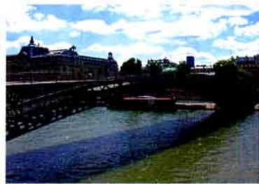
图5 单拱步行桥索勒菲利诺（Passerelle Solférino）