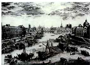
图1 中世纪铜版画中兴建卢孚宫的场面