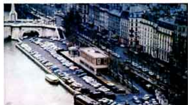
图2 19世纪80年代以前巴黎市区塞纳河两岸充斥着公共停车场