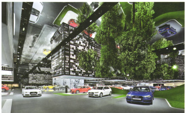
展馆内部，显然受到了电影“盗梦空间”的启发，利用镜面、LED、灯光、模拟建筑模型，建造成虚拟的城市空间

设计者：KMS BLACKSPACE, SCHMIDHUBER, 时间：2013 www.audi.de www.kms-blackspace.com