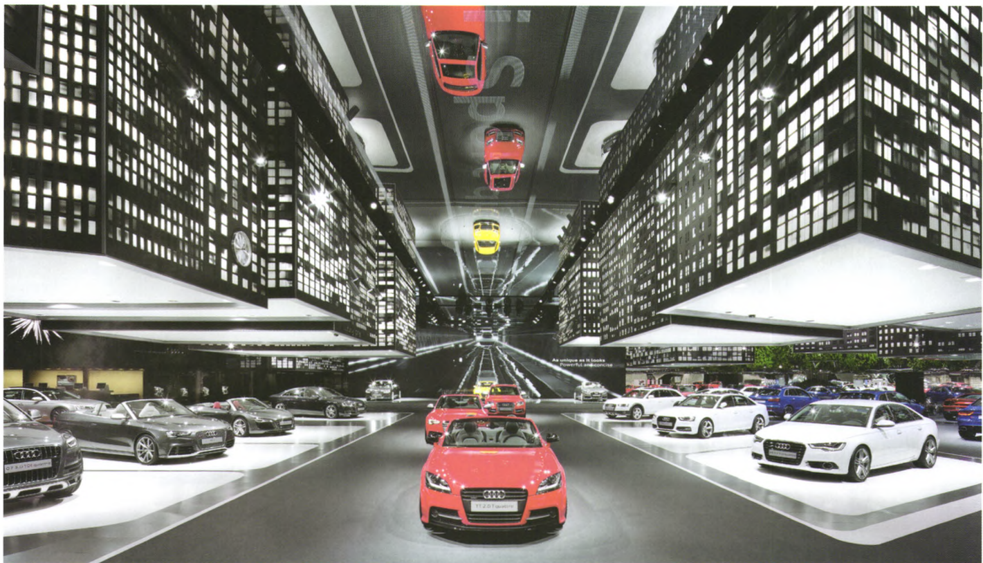
奥迪以“反转城市”为主题