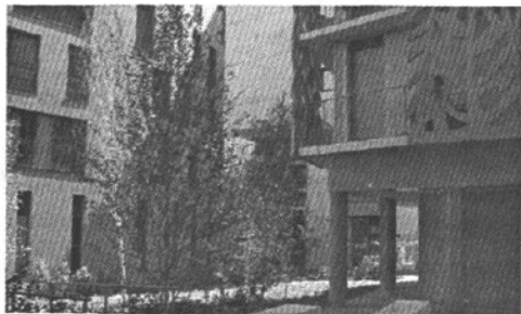
图4. 半开放的街区内庭院

在这里，不仅有具交通意义的“道”，也有具交往意义的“街”。小型街区的开发模式使街道上充满了阳光和空气，随处可见半开放的街区庭院和开放的社区公共绿地。[图4]