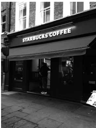
位于伦敦市考文特花园广场附近罗素街上的星巴克咖啡馆

人，他们整天待在咖啡馆里，尽情谈论政治事务，并与任何愿意倾听的人分享自己的观点。在那个时代，尽管一些咖啡馆有女员工，但是没有个体面的女人愿意到这些场所来。1674年推出的《妇女反对咖啡请愿书》中哀叹道，“一种名叫咖啡的新奇的、可恶的、异教徒的液体”已经把那些勤奋的、有朝气的男人变成了娘娘腔的、喋喋不休的懒汉，使他们只知道在咖啡馆里消磨时光。