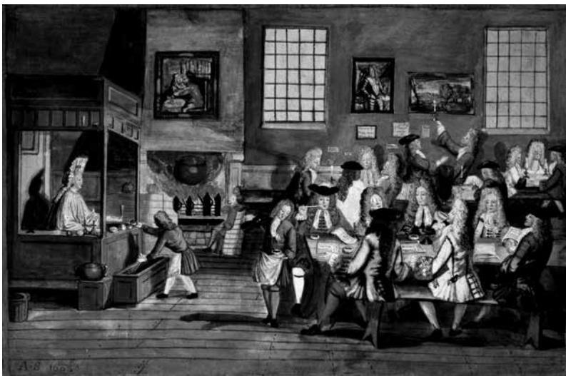
描绘伦敦咖啡馆场景的漫画 >>>