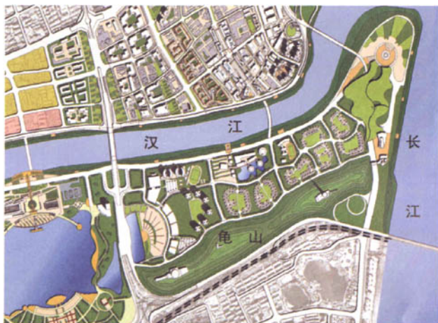
图7 2007年初武汉龟北概念规划之综合方案

首要目的,方案中对工业遗产的态度基本是在全部铲平的基础上建造新的工业博物馆,以文字和小型纪念物等形式来体现该地块的历史特质。这样的规划比较容易进行分期开发、分区建设,也容易重塑中心地带的城市形象,代价则是牺牲地块的原始历史特性、放弃体现城市集体记忆的环境和遗产。