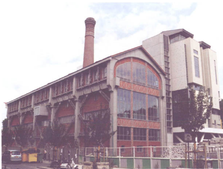
图3 巴黎塞纳河谷建筑学院（2007年，左翼为空压机厂改造成的图书馆，右翼为新建教学楼）