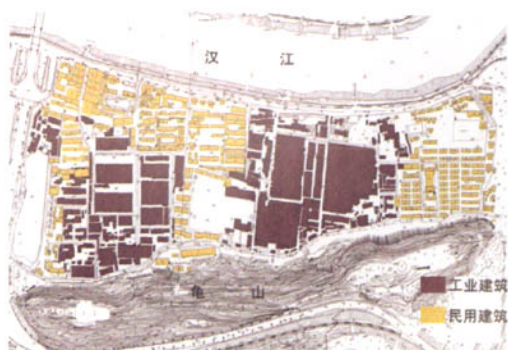
图4 武汉龟北工业建筑与民用建筑分布示意图