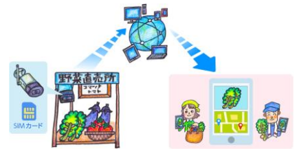
庭先直売所支援システム

先進技術導入に対する都内生産者のニーズ調査や先進技術活用事例調査に基づき、庭先直売所支援システムや東京型ブドウ環境制御栽培システム、軽量フレキシブル太陽電池利用システムなど、新たな農業システムの実証実験を行います。