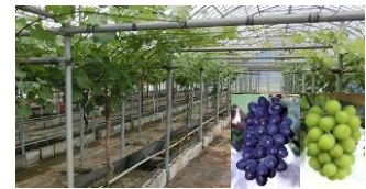
東京型ブドウ環境制御栽培システム