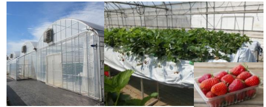
東京フューチャーアグリシステム

「東京フューチャーアグリシステム」は、（公財）東京都農林水産振興財団の登録商標（登録番号第6196995号）。