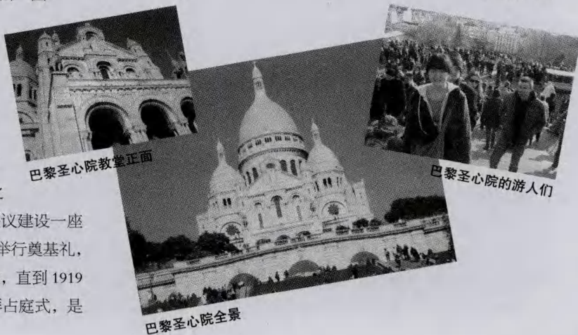
巴黎圣心院教堂正面