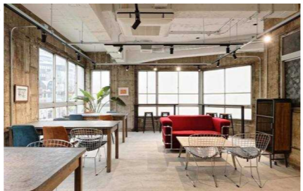
コワーキングスペース M-WORK提供

中心市街地の空洞化が進む水戸市の地方創生を目的に、市中心部の老朽化ビルを、クラウドファンディング等により集めた資金によりリノベーションした、コワーキングスペース&カフェ等のスタートアップ支援施設。 水戸から新しいビジネスを生み出し、地域活性化につなげることを目指し、起業を目指す個人、法人や学生に居場所や交流の場を提供。