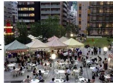
ワテラス(千代田区神田淡路町)

都市開発プロジェクトにより創出される公開空地等を柔軟に活用し、地域のにぎわいを向上させる活動を行う法人(まちづくり団体)を、東京都が登録。 公開空地等においては、一般には有料イベントの禁止等の制約がある一方、登録法人であれば、コンサート等の有料イベント、物品販売、オープンカフェ等のエリアのにぎわい創出等につながる幅広い活動が可能に。