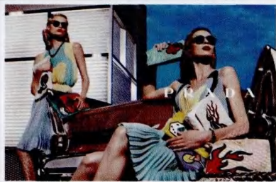
Prada 2012春夏广告片， 上世纪发型和妆容，复古大框眼镜

或许因为2012年伦敦奥运会的影响，2012春夏T台上，熟悉的运动风以华丽的方式回归：设计师们让产品既保持舒适的运动感，又在细节之处散发出优雅时尚，重新塑造出带有时髦与前卫的运动风。眼镜自然也不例外，一众大牌也纷纷以缤纷的颜色、动感的设计，向流行正式宣告奢华运动风在今天的华丽回归：Prada 2012春夏广告大片，采用色彩浓烈的上世纪50年代发型和妆容，配合廓形鲜明、色彩饱和的大框太阳镜；CHANEL 2012春夏眼镜，一改之前珍珠、蕾丝、贝壳的女性化优雅路线，从赛车运动中汲取灵感，演绎出坚毅动人的曲线；Marc Jacobs 2012夏季系列采用“上世纪80年代风情撞击缤纷色块”；莲娜丽姿 (Nina Ricci) 2012春夏系列女装大片大胆选用蓝白相间、廓形分明的太阳镜搭配与珠光宝气的服装相搭配，进一步拓展了运动风的混搭空间。