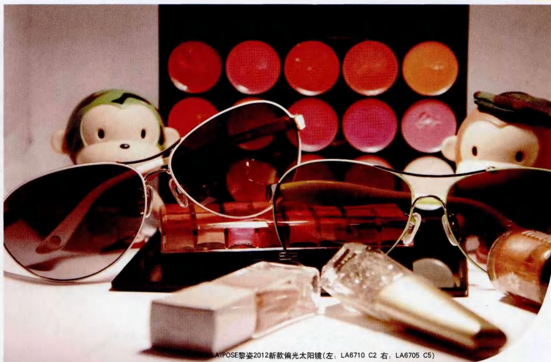
AIPPOSE黎姿2012新款偏光太阳镜(左: LA6710 C2 右: LA6705 C5)