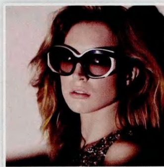
Nina Ricci 2012新款眼镜 大胆将蓝白运动风太阳镜与珠宝服装混搭