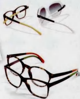
CHANEL 2012春夏眼镜， 灵感来源赛车运动