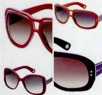
Marc Jacobs 2012 Summer Eyewear Collection 80年代风情撞击缤纷色块

牌还在设计中掺杂了不少复古元素，这也可以理解，本来伦敦时尚很大程度上就是奢华复古风的代名词，再加上带着淑女味儿的复古风虽然已经大张旗鼓地流行了四季，但颇受欢迎，似乎没有消退的迹象。因此，只要消费者尚未厌倦，设计师和零售商们就会沿着此路坚定不移地走下去。只不过如何借用伦敦奥运会的噱头，将运动、复古做深做透，做出风格，各个品牌商也动足了脑筋，所以一副副既摩登又复古、既奢华又运动的眼镜纷纷跃出眼帘，激发出观者与与众不同的新鲜感受，也就不足为奇了。