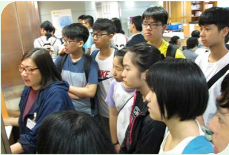
学生参观土地注册处客户服务中心之自助查册终端机