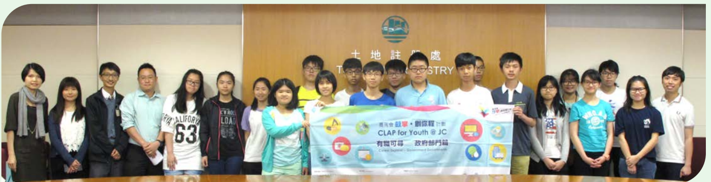
东华三院陈兆民中学到访